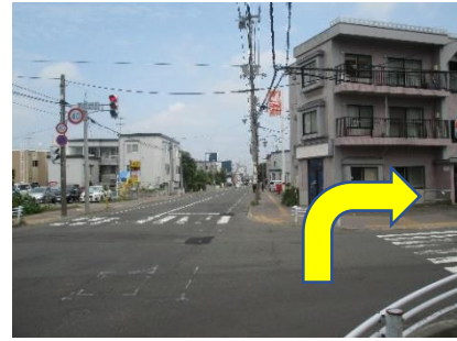
④セブンイレブンを過ぎてひとつ目の交差点を右折(信号を渡ってから)