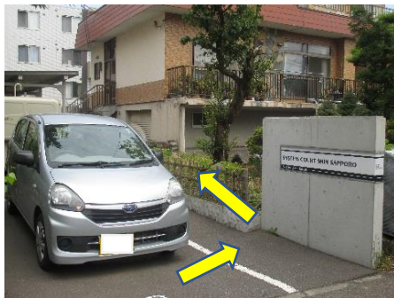
⑤「システムコート新札幌」の表示と駐車場の間に入っていき直進