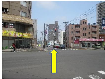
②国道12号線も越えて直進