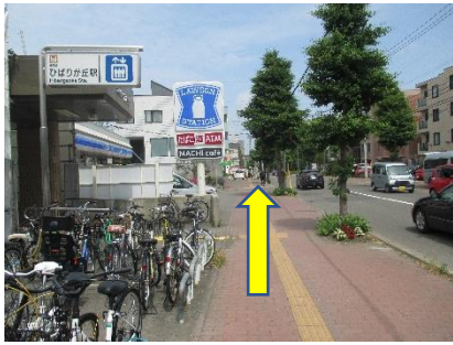
①ひばりヶ丘駅の1番出口から外に出て、左手にあるローソンの前を直進