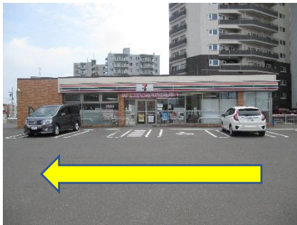
③セブンイレブンの前をそのまま直進