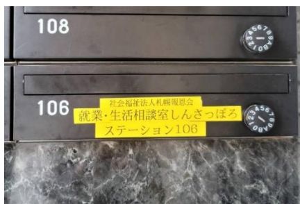
⑦郵便受けに黄色いシールが貼ってあることを確認して「1・0・6・呼出」とボタンを押してください