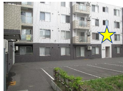
右斜め前の玄関です