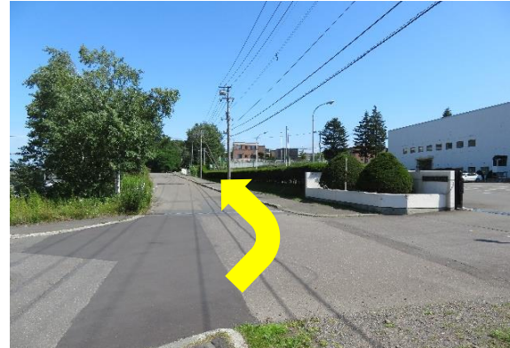
6、渡り切ったところで左手の道へ進み、奥へ直進。