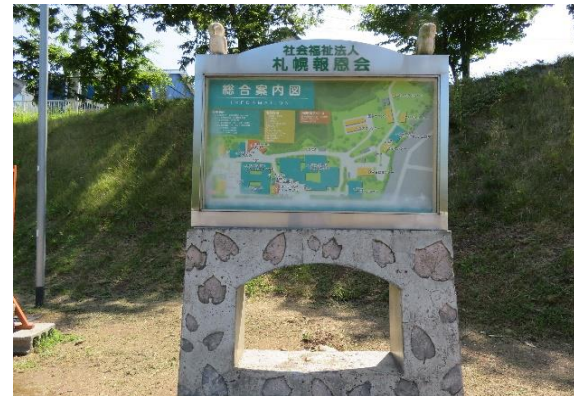
7、右手に法人の看板あり。この坂を上り到着。徒歩6分程。