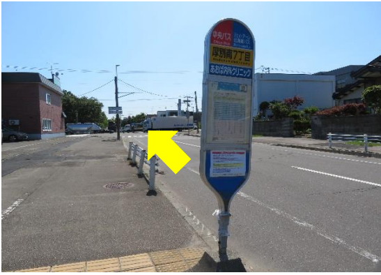
1、新札幌駅バスターミナルから乗車後、6つ目の「厚別南7丁目」で降車。