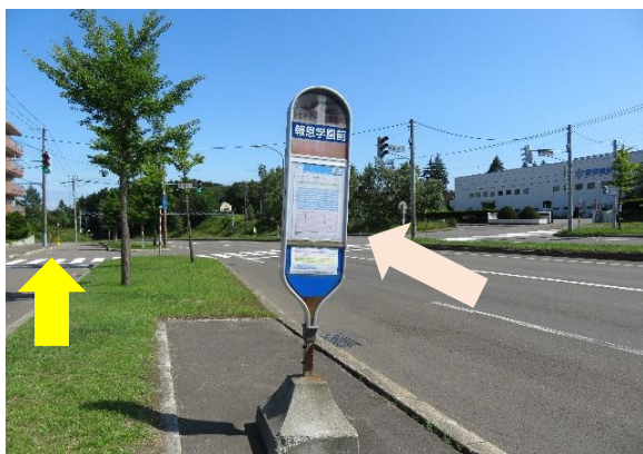
4、信号手前到着。 大谷地駅バスターミナルから乗車の方はこちら「報恩学園前」で下車。