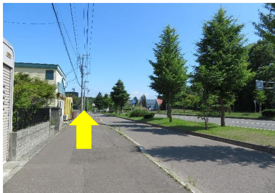
3、国道274号線を左折後、西の里方面に向かって次の信号が見えるまで直進。